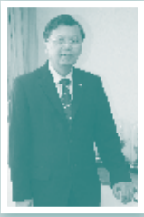
นายพงศ์สุระ ไกรนรา รองอธิบดีกรมพินิจและคุ้มครองเด็ก และเยาวชน ฝ่ายบริหาร